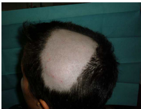
Figura 3. Paciente con espondilitis anquilosante HLA-B27 positivo que desarrolló alopecia areata progresiva tras el inicio de terapia anti-TNF, con extensión hasta casi media calota a los 15 días de la cuarta infusión de infliximab.

hayasido de anticuerpos monoclonales sugeriría una mayor asociación de estos fármacos con este efecto adverso. Su mecanismo patogénico no es bien conocido, y, de hecho, se considera el TNF- \alpha una citocina asociada con el desarrollo de alopecia al haber demostrado in vitro una inhibición del crecimiento del cabello. Sin embargo, el tratamiento con fármacos anti-TNF no ha demostrado ser eficaz en el tratamiento de la alopecia, como se demostró en un ensayo clínico con etanercept 90 . Algunos autores sugieren que el bloqueo producido por los fármacos anti-TNF podría producir una disregulación de citocinas, como el \alpha -interferon y la activación de células T autorreactivas produciendo el desarrollo de alopecia areata en individuos predispuestos 85 .