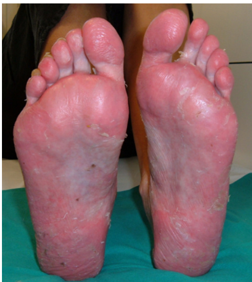
Figura 1. Pustulosis plantar con afección ungueal en paciente con enfermedad de Crohn fistulizante tras inicio de tratamiento con adalimumab.

3 principales morfologías de estas lesiones, cada una con diferente frecuencia: psoriasis pustular (56%), placas de psoriasis (50%) y psoriasis guttata (12%) 53 , aunque también pueden existir otras presentaciones cutáneas como psoriasis eritrodérmica o psoriasis invertida, entre otras, generalmente con una menor frecuencia 58 . Sin embargo, una de las lesiones más características y frecuente asociada al tratamiento con anti-TNF es el desarrollo de pustulosis palmo-plantar (fig. 1). Se caracteriza por el desarrollo de pequeñas ampollas, de contenido estéril, localizadas en palmas y plantas, con sensación de quemazón y picor, que se asocia a eritema, e hiperqueratosis. Asimismo, se calcula que un 15% de los pacientes presentan más de un tipo de lesión, sin haberse hallado correlación estadística entre el tipo de lesión cutánea y la enfermedad de base 53 . También se ha descrito afección ungueal con cambios típicos de psoriasis como onicólisis, alteración de la coloración y pitting ungueal 53 .